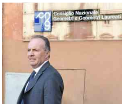
Maurizio Savoncelli | Presidente Consiglio Nazionale Geometri.

«Il primo effetto delle misure varate dal Governo – afferma Maurizio Savoncelli, Presidente del Consiglio Nazionale Geometri e Geometri Laureati – è la minore liquidità dovuta all'inevitabile contrazione delle attività professionali, molte delle quali difficilmente erogabili sia a fronte delle legittime e condivise raccomandazioni previste sin dal Dpcm 11/3/2020 (dalla distanza interpersonale alle limitazioni degli